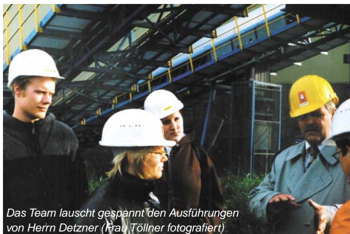
Das Team lauscht gespannt den Ausführungen von Herrn Detzner (Frau Töllner fotografiert)