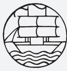
Jan Tschichold, 1923