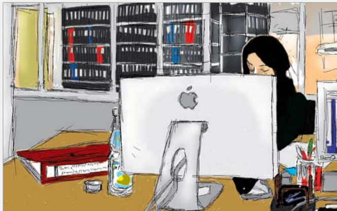
Skizze von Melanie Holzapfel/ Darstellung des Praktikantenarbeitsplatzes